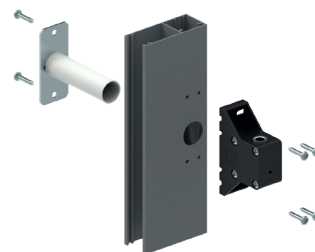
Pose sur coulisse