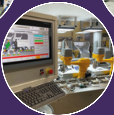
Assemblage des verrous

Une profileuse dédiée au tube ZF54 3 000 km de tube profilés chaque année