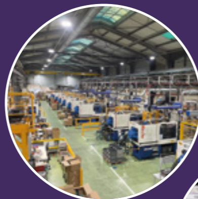
Injection des maillons